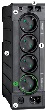
Eaton Ellipse PRO 650