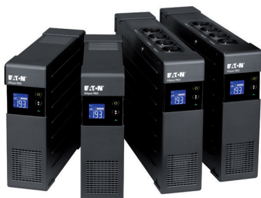
Gamme Ellipse PRO