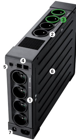
Eaton Ellipse PRO 1600