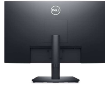
Vue arrière - Logement de gestion des câbles

Réglez facilement l'écran selon votre angle de vue préféré.